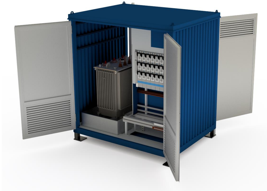
Une innovation créée, mise en œuvre et réalisée par le team: le bâtiment technique COMO.