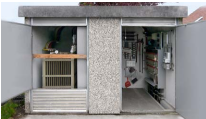
Transformatorstation vor dem Umbau