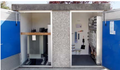
Transformatorstation nach dem Umbau