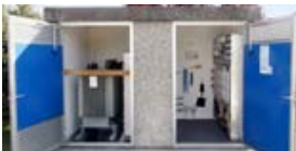
Stazione di trasformazione dopo i lavori di riadattamento