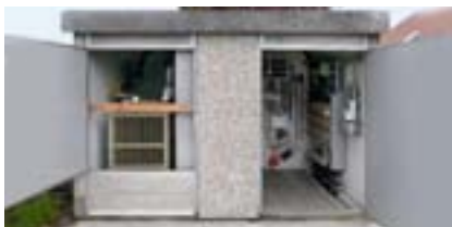
Stazione di trasformazione prima dei lavori di riadattamento