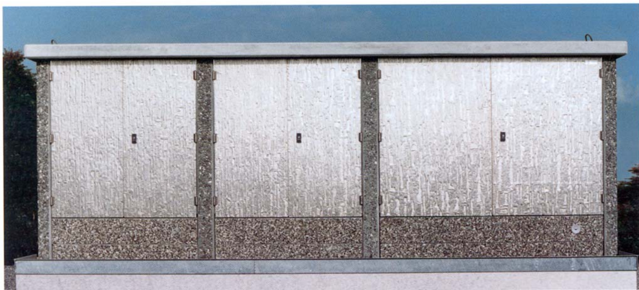
Il posto di sezionamento MT come stazione di pompaggio con tre compartimenti separati.

Tutti i pezzi costruttivi vengono protetti dalle intemperie mediante trattamenti speciali. Il calcestruzzo viene impregnato. Le porte consistono in alluminio strutturato pieno, anodizzato e quindi dai colori solidi resistenti ai raggi UV.